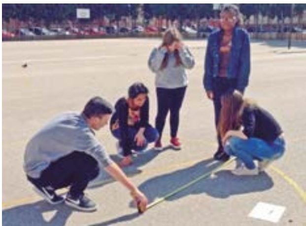
Estudiantes del 10mo año de EGB del Colegio Técnico Nacional "Herlinda Toral", en la recolección de datos.

Además, con el ABP como eje transversal de la didáctica aplicada se encontró referentes teóricos sobre la inclusión educativa, la cual nos amplía una visión sobre diversos aspectos para atención a las necesidades de aprendizaje dentro el aula y de esa manera mejorar el proceso de aprendizaje en el área de matemática.