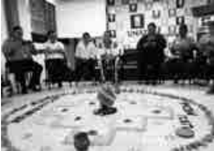
Formación permanente del colectivo docente, administrativo y de apoyo.

de aprendizajes y a la re-organización del proceso de enseñanza – aprendizaje. Tras la delegación de funciones de liderazgo a docentes encargados de la autoría y de la tutoría se comienza a normar varias estrategias para la consolidación exitosa del trabajo.