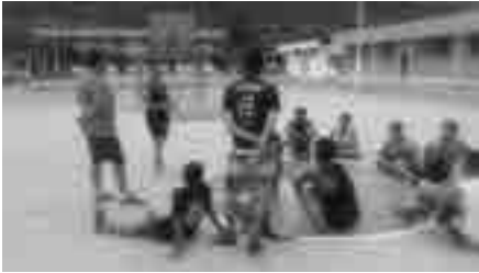
Integrantes de la escuela de básquet del GAD San Vicente en espacio formativo.

Relacionado con el Proyecto Social NOS – OTROS 11 , consiste en la utilización de las instalaciones del Centro de Apoyo por parte de otras instituciones y de la comunidad. Es un proyecto de integración; que ha coadyuvado al plan de formación externa que desde el Centro de Apoyo se ha proyectado. La infraestructura del Centro de Apoyo es de puertas abiertas, siempre y cuando los eventos aporten al desarrollo de la comunidad en las líneas del bien común.