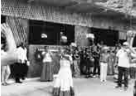
Primeras jornadas de integración deportiva y juegos tradicionales. San Vicente 2019.

La presencia de los docentes estudiantes de la carrera ha permitido fomentar en ellos, los valores institucionales a los cuales se ha hecho referencia. Se ha logrado un trabajo articulado en pos del éxito de las actividades desarrolladas en el Centro de Apoyo: Primer Aniversario de creación del Centro de Apoyo, Encuentro