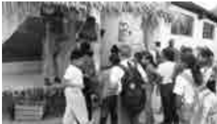
Prácticas de inmersión desarrolladas por los estudiantes de la carrera de EIB, de matriz.

Estos objetivos se han cumplido en el tiempo establecido y en este momento está en ejecución la estrategia prevista para tales fines. Desde esta perspectiva se ha ido trazando un camino que ha conllevado a logros tangibles en el diagnóstico de los estudiantes, representantes legales, docentes y directivos. Diagnóstico que ha conducido a una mirada integral de las necesidades del circuito y de esta forma, al planteamiento de una estrategia de incidencia y acompañamiento pedagógico lograda desde una construcción colectiva a través del intercambio con las personas diagnosticadas.