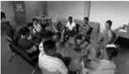
Primera reunión con actores de la sociedad.

De lo expresado en los párrafos anteriores, se nota en que la razón de ser de la universidad no se encuentra en sí misma, desde luego que no. La dinámica institucional del Centro de Apoyo en San Vicente-Manabí, así lo demuestra. Para corroborar lo afirmado se hace necesario mencionar, cómo se construyó el diagnóstico 2 , se lo asume como la primera fase de la implementación del Centro de Apoyo. Fase que tiene por objeto tejer las relaciones interinstitucionales e intercomunitarias mediante la participación comunitaria para la implementación del Centro de Apoyo. A medida que se desarrollan dichas relaciones se manifiesta el sentido bilateral de pertenencia. Donde el tramado de interconexión se confunde entre universidad y comunidad, pero sin perder cada una su propia identidad y en perfecta armonía con la Pachamama.