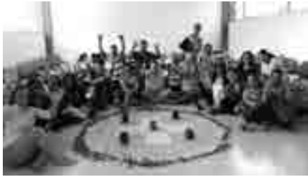
Primer curso de Educación Continua, "De la escuela tradicional a la innovadora: un reto para el docente de Manabí".

La Tertulia de Saberes es iniciativa del trabajo en territorio y que pauta la diferencia con los cursos de Educación Continua que ofertan otras instituciones y se basa en una interesante metodología con carácter humanista que conlleva a mirar las concreciones, las afectividades, las transformaciones y las mejoras permanentes de las instituciones educativas y de su talento humano.