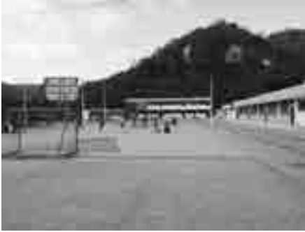
Infraestructura que utilizaría el Centro de Apoyo en San Vicente. 2017-08-02.

La Universidad Nacional de Educación concreta los postulados mencionados anteriormente, rompiendo los muros de la Matriz, para expandirse a otros territorios. Como es el caso del Centro de Apoyo en San Vicente, con alcance a la provincia de Manabí, en la región Costa del Ecuador. Provincia que su