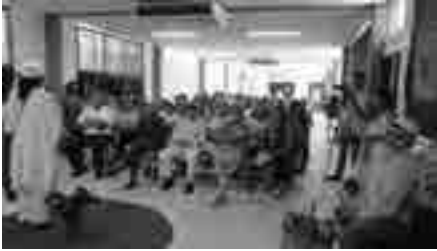
Segundo encuentro intercultural San Vicente 2019. "Otros rostros, otras culturas"

se realiza la motivación y la calidad de los eventos. Han sido de concurrencia notoria ante el proceso de difusión. Digno es de destacar aquellos aportes de los docentes de la zona, autoridades, docentes y profesores en formación de la matriz de la UNAE.