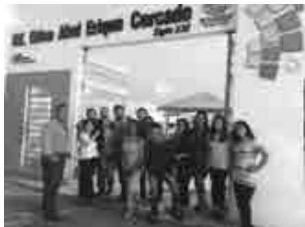
Grupo de la carrera Educación Intercultural Bilingüe EIB en prácticas de inmersión desde matriz.

Experiencias con posibilidades de réplica, y que desde el acompañamiento pedagógico a las instituciones educativas ha propiciado solidificar la relación interinstitucional.