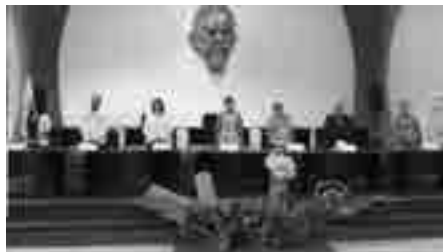
Evento académico Ideas en Acción. Ciudad Alfaro-Montecristi.

consciente, la co-construcción del conocimiento y la educación de la comunidad. A través del Programa de Educación Continua se ha evidenciado la réplica en otros contextos del país; comprobados en la práctica pedagógica.