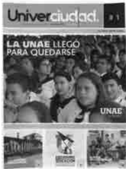
Portada del primer boletín bimensual: Univerciudad.

varias culturas ecuatorianas quienes han dado a conocer las bondades de la Pachamama y todo esto ha generado un impacto en el desarrollo económico local, de la provincia y de la región.