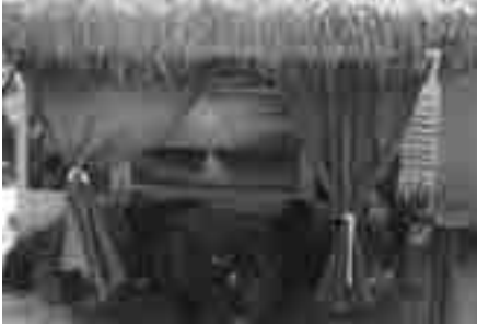
Uno de los ambientes de aprendizaje del Sendero Pedagógico.

El Sendero Pedagógico se evalúa sobre la base de la gestión asumida. En este sentido, las instalaciones tienen un estado favorable. Consta de nueve ambientes de aprendizajes y está previsto establecer otros: casas alegóricas por regiones del Ecuador. El tipo de gestión asumida ha sido por autogestión. El número de personas visitantes al Sendero Pedagógico asciende aproximadamente a 3000 personas.