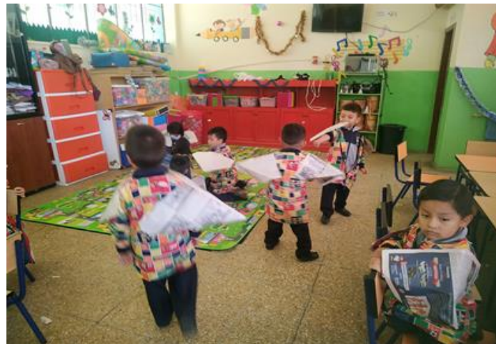
Ilustración 11: Ejecución de la actividad: "Soy una mariposa", los niños están moviendo sus alitas de papel como una mariposa.