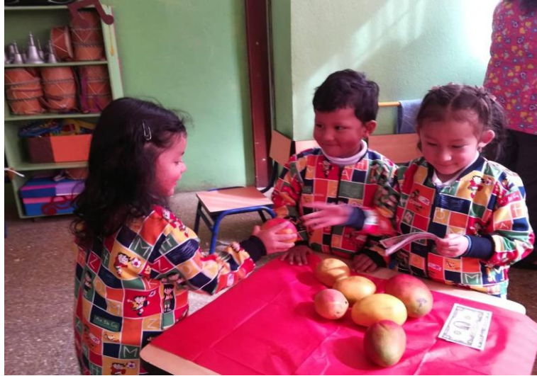
Ilustración 4: Ejecución de la actividad: "Soy un...", jugando con los niños a ser vendedores y consumidores.