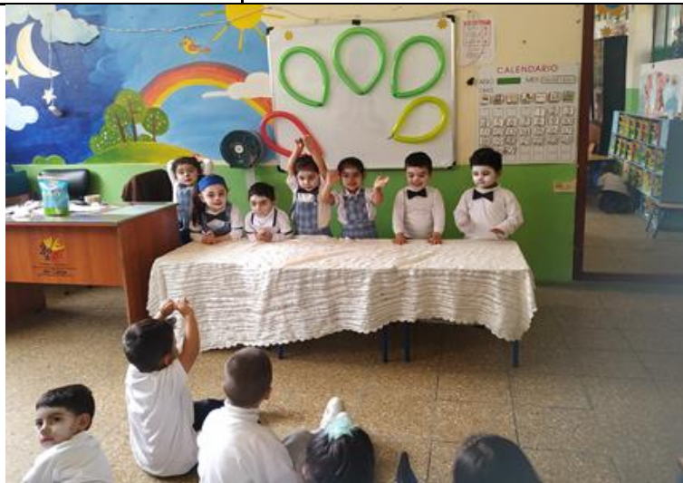
Ilustración 6: Ejecución de la actividad: “Me muevo y adivinas”, el grupo está mostrando la expresión de felicidad a sus demás compañeros.

nuevamente al aula, se ubican en el escenario para expresar su emoción, mientras el público (los demás niños) adivinan lo que expresan sus compañeros, teniendo en cuenta que los niños no podrán hablar mientras realizan la mímica, solamente serán gestos. También se puede utilizar cartillas con diversas imágenes como de animales, acciones y sensaciones, de tal manera el niño pueda reproducir.