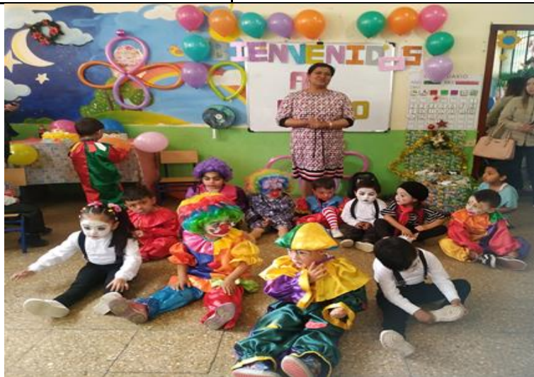
Ilustración 13: Ejecución de la actividad: "Bienvenidos al circo", el grupo representando a mimos y payasos.

A manera de agradecimiento con los niños, los padres y la educadora se degustará de un pastel fortaleciendo lazos de compañerismo en el aula de clase.