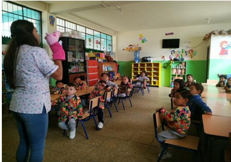
Ilustración 7: Ejecución de la actividad: "Mi amigo que habla", realizando la dinámica de la perdiz al comienzo de la sesión.