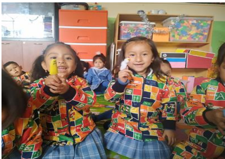
Ilustración 8: Ejecución de la actividad: "Mis deditos me cuentan", las niñas están imitando las acciones de los dedos tristes.