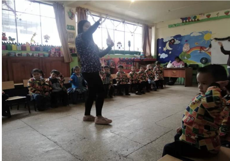
Ilustración 10: Ejecución de la actividad: ¡Simón! Cuéntame una historia, los niños están escuchando el cuento.