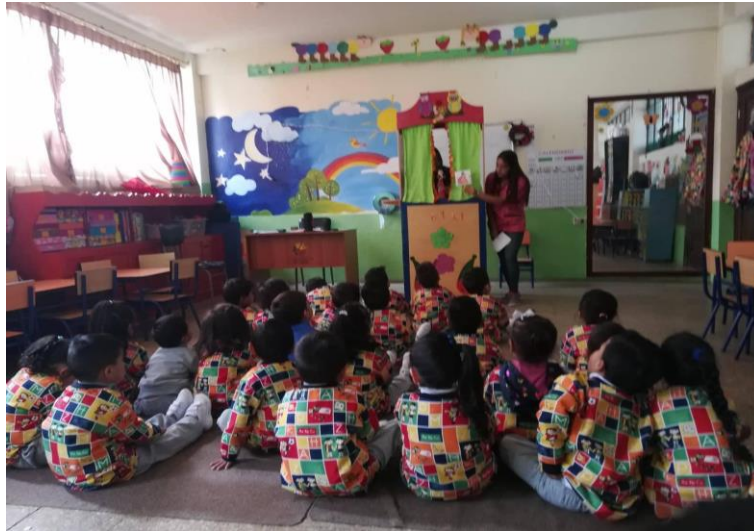
Ilustración 9: Ejecución de la actividad: "Organiza una historia ", los niños están atentos durante el relato de un cuento.