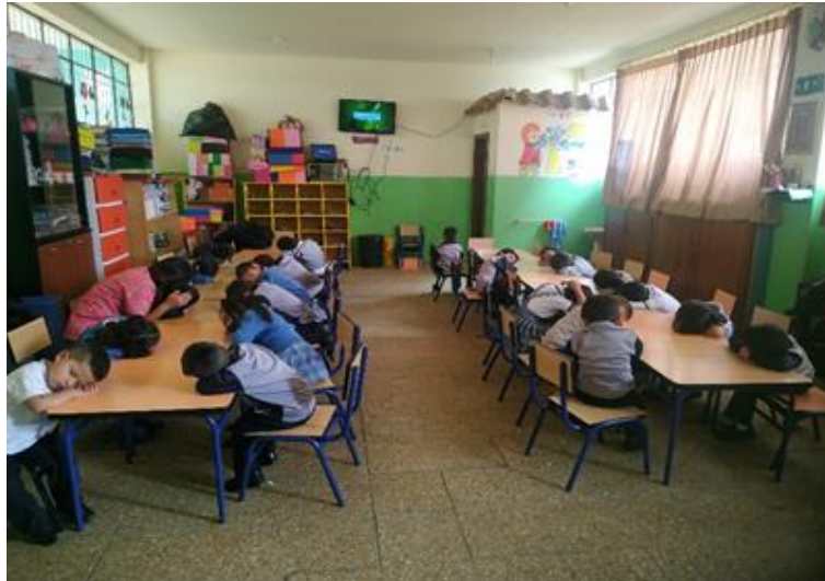
Ilustración 1: Ejecución de la actividad: “Una tortuguita en el fondo del mar”, donde los infantes se relajan, mientras concilian el sueño.