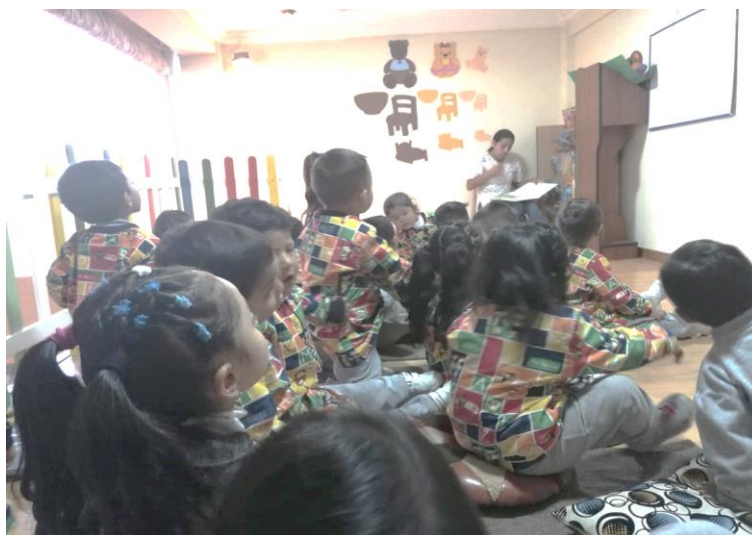
Ilustración 12: Ejecución de la actividad: "Observo y aprendo", los niños están atentos a las indicaciones.