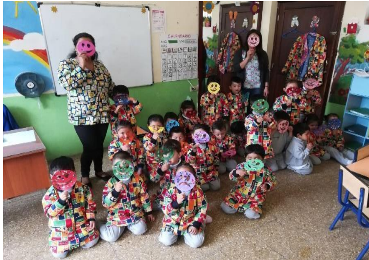
Ilustración 5: Ejecución de la actividad: “Expreso lo que siento”, los infantes exponen el trabajo realizado.