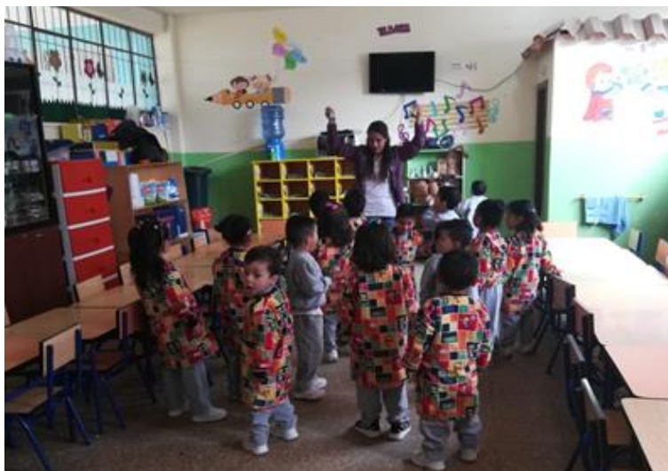
Ilustración 3: Ejecución de la actividad: “Baile de las estatuas de Marfil”, bailando junto al grupo hasta que se detenga la música.