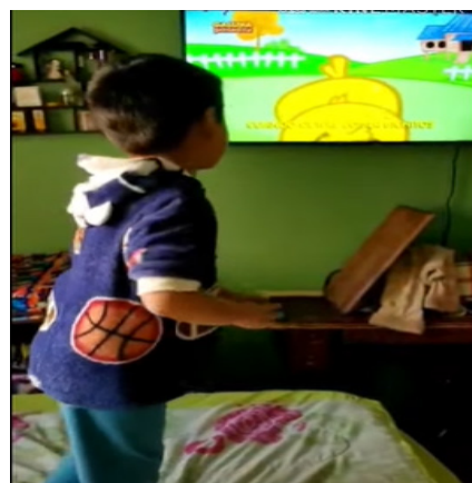
Imagen 2. Estrategia didáctica para el proceso de enseñanza-aprendizaje