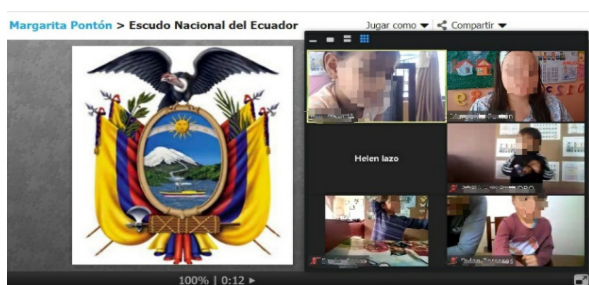
Imagen 5. Estrategia didáctica para el proceso de enseñanza-aprendizaje