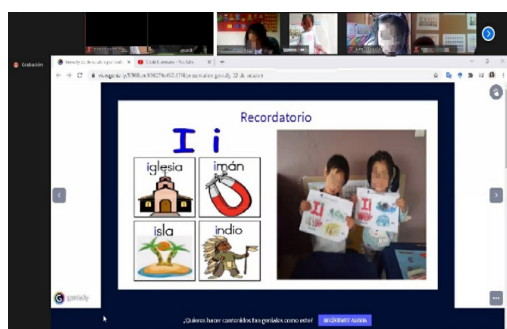
Imagen 3. Desarrollo de experiencias de aprendizaje