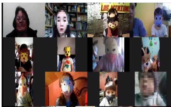
Imagen 4. Estrategia lúdica