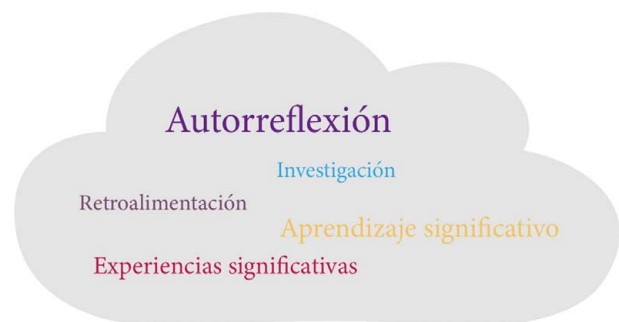
Figura 1. Categorías y subcategorías de análisis

Las actividades desarrolladas, la mayoría de forma práctica, generaron en los estudiantes una autocrítica sobre su aplicación dentro del contexto virtual. Para registrar dichas reflexiones se realizó una guía de preguntas que se consolidó en un documento como producto final y que provocaron un análisis reflexivo de cada una de las actividades realizadas. El estudio se enfocó en generar un pensamiento reflexivo en los estudiantes, de tal forma que, desde el análisis de la propia práctica, pudieran transformar la realidad social; en otras palabras, como lo mencionan Nieva y Martínez (2016) se considera la reflexión como elemento catalizador de la autotransformación para alcanzar el cambio social. Los resultados se describirán de acuerdo a las categorías y subcategorías que se recogen en el siguiente gráfico: