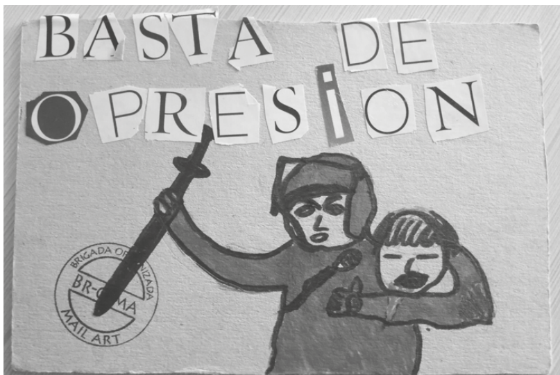
Figura 6. Postal de Martín González, anverso