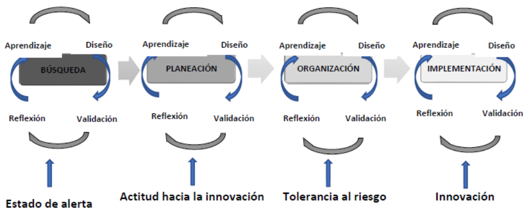
Figura 1. Proceso de Aprendizaje centrado en Emprendimiento