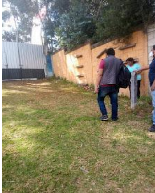
Ilustración 1. Reconocimiento del área designada para el proyecto.