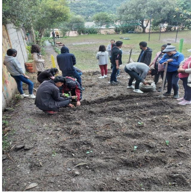
Ilustración 3. Creación del huerto escolar con la colaboración de los representantes, docente del área de ECA, estudiantes y practicantes de la UNAE.