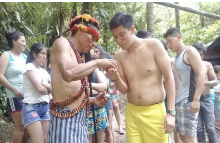
Ceremonia del baño de purificación en la Cascada Sagrada. Tuna Yantsa. GOPC.

Luego de ello recibimos el almuerzo cultural shuar el yunkúrak con productos del medio: carne de pollo