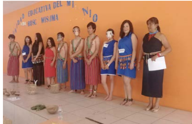
Clase demostrativa en la uemgl-bosco wisuma de yukias. Tema mito ipiak (achiote) y sua nua (genipa). Estudiantes UNAE.

El dueño y guía espiritual elevó una plegaria a Arútam en la personificación de Tsunki (señor de las