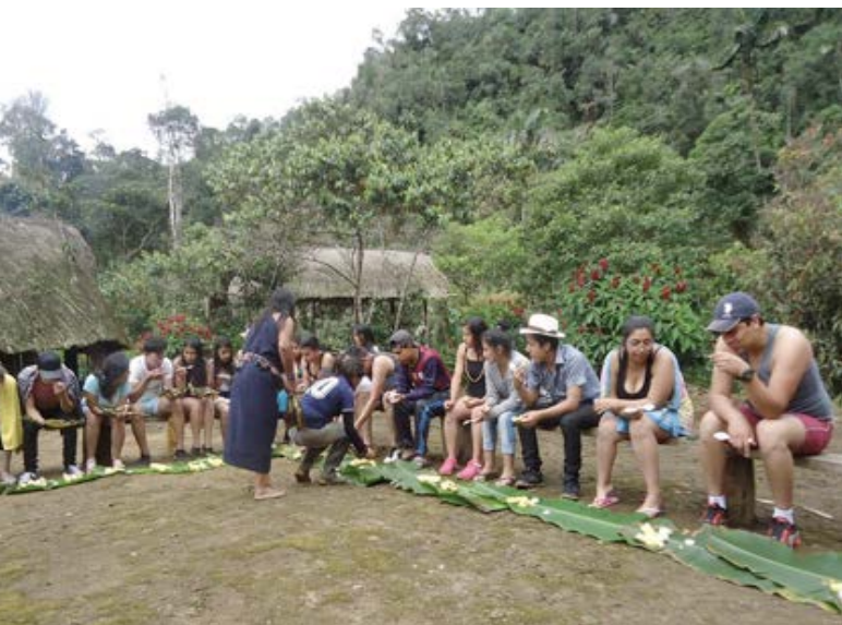
Yunkúrak: Comida típica shuar