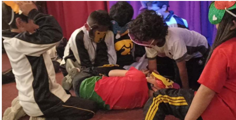
Nota: Escena final de la obra de teatro (Pérez y Urgilés, 2023).

Se volvió a formular la pregunta generatriz: ‘¿Qué es el teatro?’, como parte de la fase final del ABP. Después, se aplicó una autoevaluación, en la cual se utilizó la escala “excelente, buena