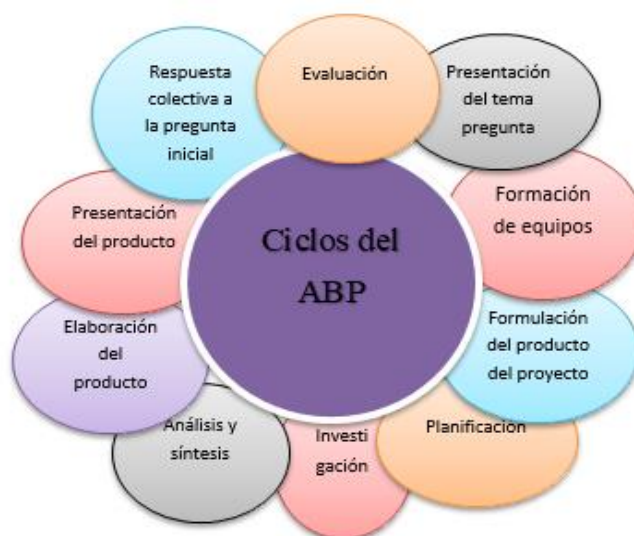
Gráfico 1: Ciclo de la metodología del Aprendizaje basado en proyectos

Fuente: Presentación ppt “Taller ABP”, elaborado por Malena Washima