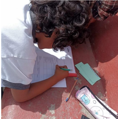
Nota: Autoevaluación y Coevaluación (Pérez y Urgilés, 2023).

Para finalizar la implementación, se aplicó heteroevaluación de la presentación de la obra teatral, nota que fue parte de la asignatura de ECA, mediante una rúbrica con una escala del 1 al 5, la cual tenía diferentes categorías relacionadas con su participación en el desarrollo de la obra teatral.