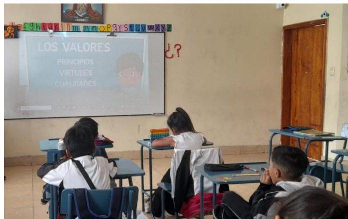
Imagen 2: Conceptos sobre los valores

Nota: Fotografía de la Presentación del video sobre los valores (Pérez y Urgilés, 2023).