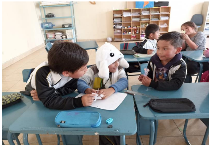
Imagen 3: Entrega de recursos didácticos

Nota: Entrega de imágenes con el personaje correspondiente (Pérez y Urgilés, 2023).