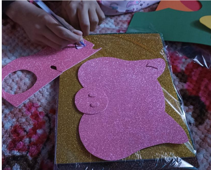
Nota: Elaboración de los antifaces (Pérez y Urgilés, 2023).

En esta sesión, se realizó la entrega del vestuario a cada estudiante de acuerdo a su personaje. Después de esto, se procedió a ajustar el antifaz a los estudiantes para que se sintieran cómodos al momento de proceder con los ensayos.