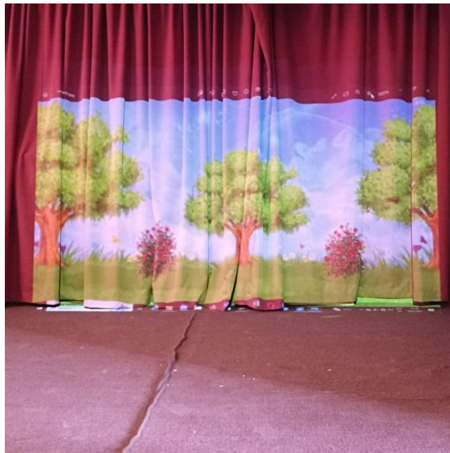
Imagen 7: Preparación de la escenografía

Nota: Adecuación del lugar para la presentación de la obra (Pérez y Urgilés, 2023).