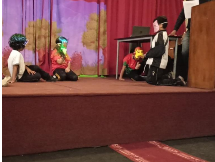
Nota: Presentación de la obra (Pérez y Urgilés, 2023).

Luego, se llevó a cabo la presentación final de la obra teatral, en la cual se contó con la ayuda del docente de la asignatura de ECA, quien fue el narrador de la historia y los niños iban apareciendo cuando debían.