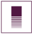
Imagen 8: Puesta en escena de la obra teatral