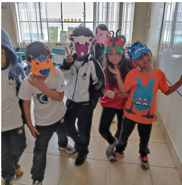
Nota: Entrega de antifaces a los niños (Pérez y Urgilés, 2023).

En los ensayos de la obra teatral, se organizó a los estudiantes en grupos de animales salvajes y domésticos. Las facilitadoras fueron narrando la historia, que en la sesión anterior fue creada por los mismos estudiantes mientras cada personaje iba apareciendo para representar la escena que le tocaba.