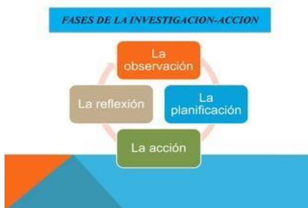
Gráfico 2: Fases de la Investigación Acción

Nota. Fases de la Investigación Acción . [Presentación de Slideshare], Coro, 2014,