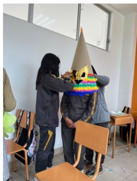
Figura 5: Imagen que muestra la construcción de la máscara de la Curiqingue

Nota: Trabajo colaborativo en la elaboración de la máscara de la Curiqingue.