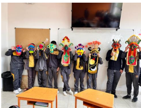
Figura 8: Imagen que muestra las máscaras del Aya Uma culminadas