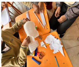
Figura 7: Imagen que muestra el proceso de creación de la máscara del Aya Uma

Nota: Construcción de la máscara del Aya Uma.