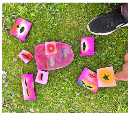
Figura 10: Imagen que muestra la culminación del diseño a la máscara de la Contradanza

Nota: Finalización de la máscara de la Contradanza