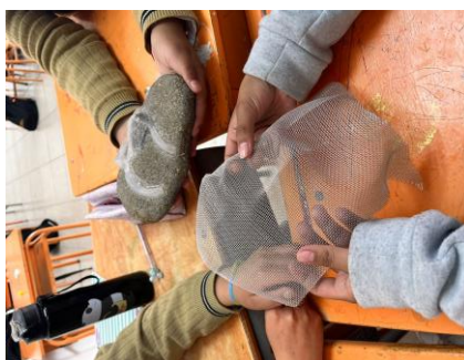
Figura 9: Imagen que muestra el proceso de creación de la máscara de la Contradanza

Nota: Creación de la máscara de la Contradanza con molde de piedra.