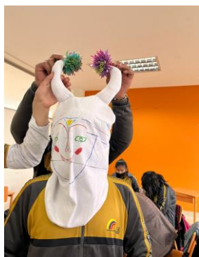
Nota: Segunda parte de la parte de construcción de la máscara del Wiki.

Ya completada la forma de la máscara, se procede a dejar libertad a los estudiantes para el diseño de su máscara, teniendo en cuenta la simbología espiritual y/o flora y fauna del lugar. En este proceso creativo los estudiantes dejan fluir su imaginación y creatividad para capturar la esencia de la máscara y del personaje.