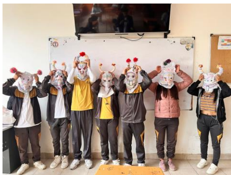
Figura 4: Imagen que muestra los productos finales de la máscara del Wiki

con el fin de mejorarlos y fortalecer los símbolos de las máscaras, demostrando gran habilidad en el dibujo y creación, todo esto dentro del tiempo establecido que fueron cuatro sesiones que darían lugar a las dos semanas correspondientes.