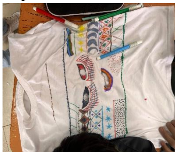
Nota: Construcción máscara del Wiki.

Para la parte central de esta elaboración los estudiantes debían utilizar los retazos de tela sobrante para dibujar lo que corresponde a los cuernos o cachos del “Wiki”, mismo que con la ayuda de tela restante o esponja se le dio forma y/o volumen. Como siguiente paso los educandos debían coser y/o pegar la forma de la máscara, la lengua, los cachos y los hilos de la parte superior de la máscara con la utilización de hilo de colores.