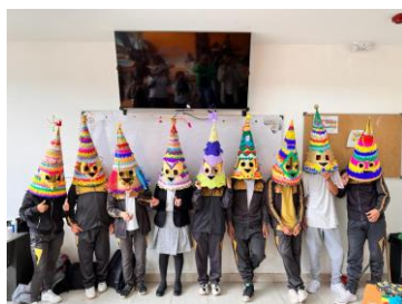
Figura 6: Imagen que muestra los productos finales de la elaboración de la máscara de la Curiqingue

Nota: Máscaras de la Curiqingue finalizadas