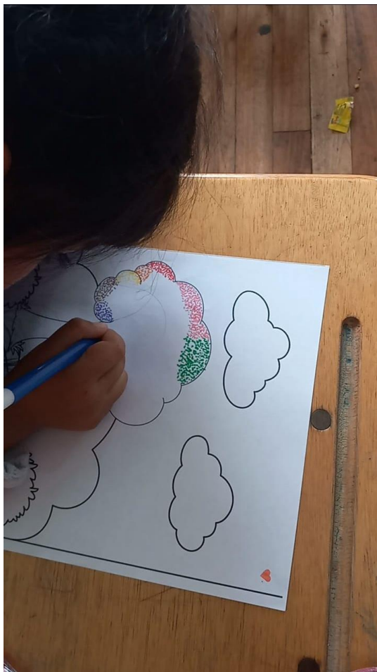
Figura 14 Práctica de la técnica utilizando marcadores