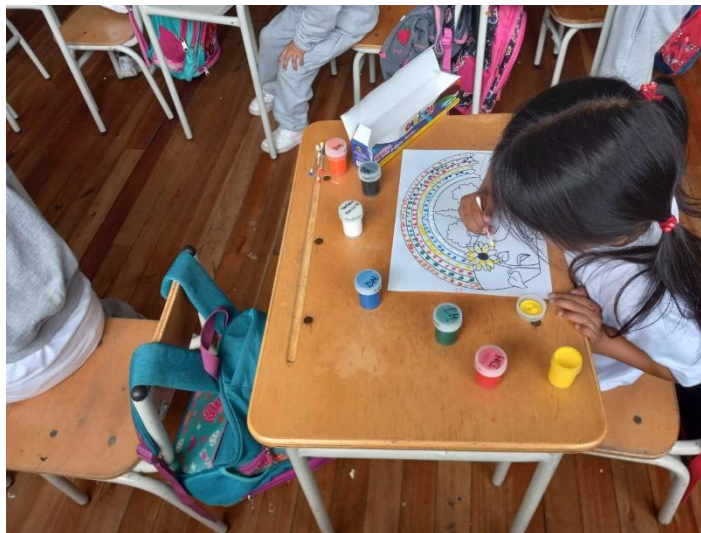
Figura 15 Practica con pinturas para ejecución de la obra