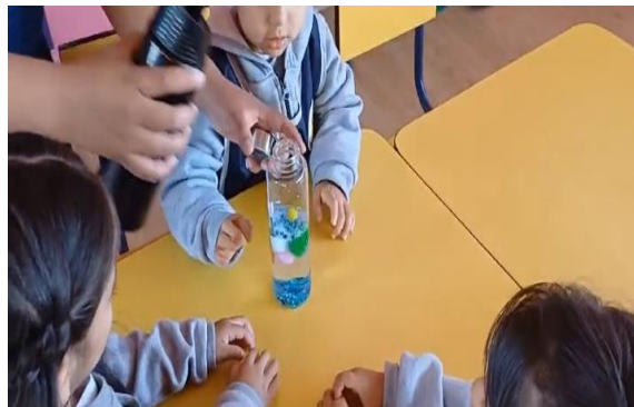
“Mi mandala mágica”

Descripción de la actividad: En primer lugar, se les explicó a los niños acerca de qué trataba la clase. Después se formó 4 equipos de 6 integrantes, donde los niños jugaron a ser detectives, con el fin de salir a buscar en el patio del CEI pistas para armar un mensaje sobre