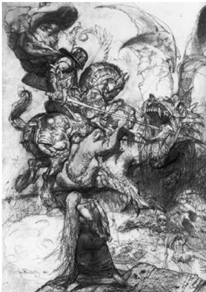
Ilustración Original - Simon Bisley

La siguiente ilustración es un cover de la obra - San Jorge y el Dragón de Simon Bisley un dibujante y colorista inglés nacido el 4 de marzo de 1962.