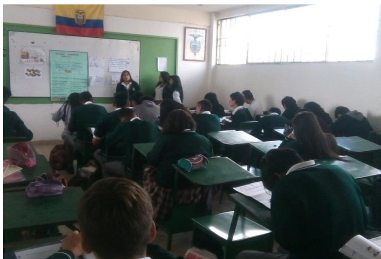
Los equipos cooperativos durante la exposición de sus trabajos