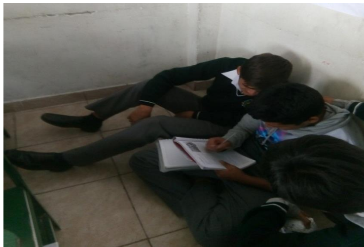
Estudiantes desarrollando análisis y reflexión durante la investigación cooperativa