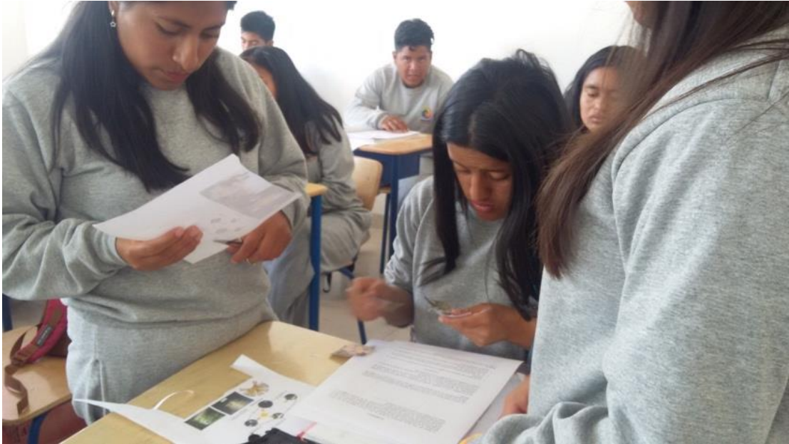
La toma de Cochasquí: presentación feria de la ciencias.