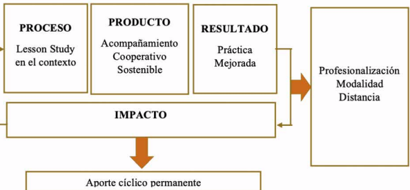
Metodología Lesson Study contextualizada. Elaborado por: los autores